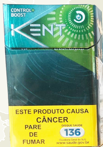
Encarte no Kent control boost