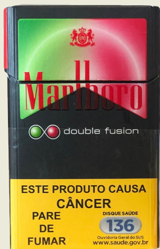
Encarte no Marlboro double fusion

No Brasil, os maços de cigarros possuem cores vibrantes e brilhantes, além de um design elaborado, ambos destacando a presença de cápsulas de sabor. Muitos maços utilizam encartes para promover os sabores.